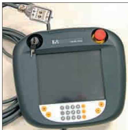
Рис. 5. Мобильное устройство (сенсорный экран) для программирования промышленных систем управления

Примерами могут служить автоматические сборочные машины, испытательные приборы, установки последовательного шагового экспонирования и вообще машины, которые содержат большое количество соединительных узлов. Но в машиностроении и автоматизации бывает так, что программирующие устройства, устройства ввода/вывода и т. п. подключаются через внешние соединители (рис. 5). В качестве таких