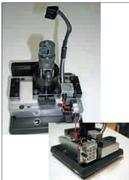
Рис. 4. ODU MAC на испытательном стенде для инжекторных клапанов

компьютером через ODU MAC (ответная часть). Испытательная линия оборудована сотнями стендов, которые обслуживаются одним или двумя операторами.