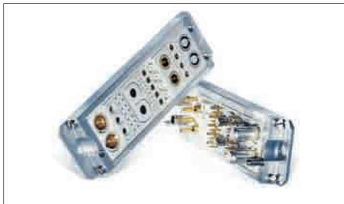
Рис. 1. ODU MAC в алюминиевой рамке с модулями, а также с высоковольтными, оптическими, пневматическими, сигнальными и высокочастотными контактами

На рис. 1 показаны основные модули и контакты ODU MAC. Они могут быть помещены вместе в алюминиевую рамку (рис. 1) или в DIN-корпус (рис. 2) в том порядке, в котором нужно заказчику. Все контакты могут быть установлены и демонтированы за очень короткое время. ODU MAC может заменить множество отдельных соединителей или разработанное на заказ изделие.