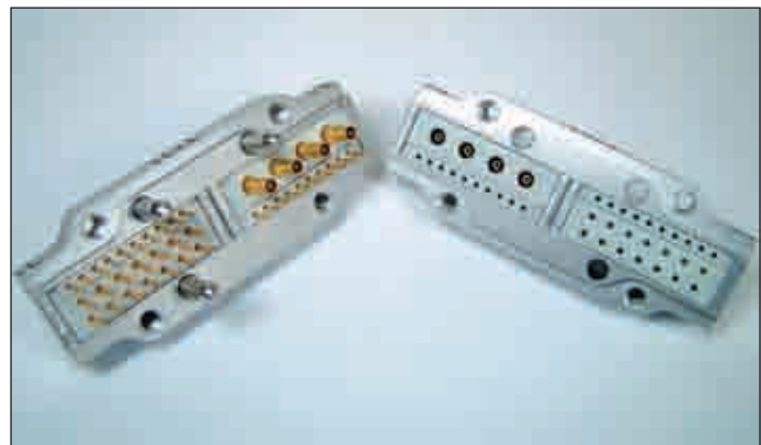
Рис. 3. Соединитель для внутреннего соединения частей сканирующего устройства ЯМР

Инжекторные клапаны установлены на испытательных стендах и связаны со стыковочной станцией (монтажная плата) и тестовым