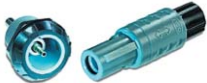
Рис. 11. Разъем MEDI-SNAP с оптической вставкой

Разъемы MEDI-SNAP с волоконно-оптической вставкой рассчитаны на более чем 1000 циклов соединения и разъединения, они имеют степень защиты IP50 в сомкнутом состоянии. Этот тип разъемов в кодировке также имеет 7 цветов и 6 вариантов ключей — от 0° до 205°. Оптическая вставка разъемов рассчитана под обжим (рис. 11) и применяется под кабель LWL-POF 980/1 мкм.