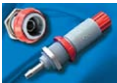
Рис. 10. Разъем MEDI-SNAP со вставкой для жидкости