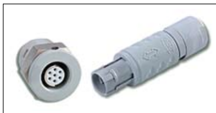
Рис. 1. Новый дизайн разъема серии MINI-SNAP PC

разъемы. Среди цилиндрических разъемов ODU большой интерес вызывают пластиковые разъемы серии MINI-SNAP PC. Эта серия разъемов ориентирована на применение в медицинских приборах, тестовом и измерительном оборудовании (рис. 1). Разъемы MINI-SNAP PC в пластиковом корпусе имеют от 2 до 27 контактов, контакты под пайку, обжим, для установки на плату. Разъемы обеспечивают более 5000 циклов соединения,