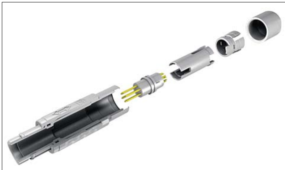
Рис. 2. Разъем MINI-SNAP PC в разобранном виде

На протяжении последних двух лет компания ODU разработала несколько специальных решений пластиковых разъемов серии MINI-SNAP PC со вставками для передачи жидкостей различных видов и типов.