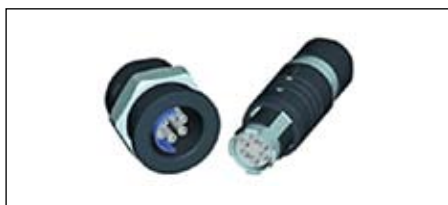
Рис. 5. Разъем MINI-SNAP PC для ультразвукового прибора

Данные следующего типа разъема: внешний диаметр — 18,7 мм, 1 вставка для передачи жидкости из нержавеющей стали, наружный диаметр — 2,5–3,5 мм, внутренний диаметр — 1 мм, 4 сигнальных контакта диаметром 0,7 мм каждый и 4 высоковольтных контакта диаметром 0,7 мм. Степень защиты такого типа разъема — IP50 в сомкнутом состоянии (рис. 5). Этот тип разъема был разработан специально для стоматологических