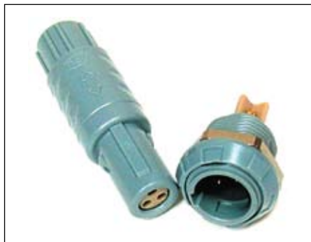
Рис. 12. Трехконтактный разъем серии MEDI-SNAP

Корпус разъема диаметром 14 мм выполнен из полисульфона. Контакты «гнездо» расположены на кабельной части (вилке), а контакты «штырек» — на его приборной части (розетке). Диаметр контактов составляет 0,9 мм, контакты покрыты золотом 0,75 мкм. Разъемы просты в сборке и применении, имеют малый вес и большой срок службы без по-