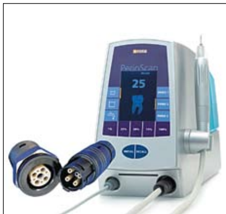
Рис. 6. Ультразвуковой прибор с разъемом MINI-SNAP PC

ультразвуковых приборов: для снятия зубного налета и камней (рис. 6).