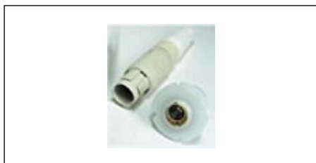
Рис. 4. Пластиковый разъем со вставкой для жидкости

Другой тип разъемов со вставкой для передачи жидкости имеет наружный диаметр 3–7 мм, внутренний диаметр 1,6–5 мм и 4 сигнальных контакта, диаметр которых составляет 0,9 мм. В таких разъемах предусмотрено отверстие для нейлоновой нити, что позволяет разгрузить провод от напряжения. Степень защиты — IP50 в сомкнутом состоянии. Внешний диаметр разъема составляет 15,7 мм. Этот тип разъемов применяется в медицинских приборах для проведения липосакции (рис. 4).