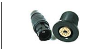
Рис. 3. Разъем со вставкой для жидкости

В данном типе разъемов можно рассмотреть разъемы со вставкой для передачи жидкости и 18 сигнальными контактами, диаметр которых составляет 0,5 мм. Вставка имеет наружный диаметр 3,1 мм, внутренний же диаметр равен 1 мм. Внешний диаметр самого разъема составляет 18,7 мм (рис. 3). Этот тип разъемов применяется в медицинском оборудовании.