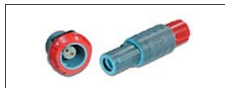
Рис. 9. Разъем серии MEDI-SNAP

Этот тип соединителей популярен у российских производителей, так как имеет хорошее соотношение цены и качества. Такие соединители востребованы производителями медицинского оборудования (рис. 9). Особенно большой интерес вызывают разъемы серии MEDI-SNAP со специальными вставками — жидкостной и оптической, а также трехконтактные разъемы для подачи сетевого питания.